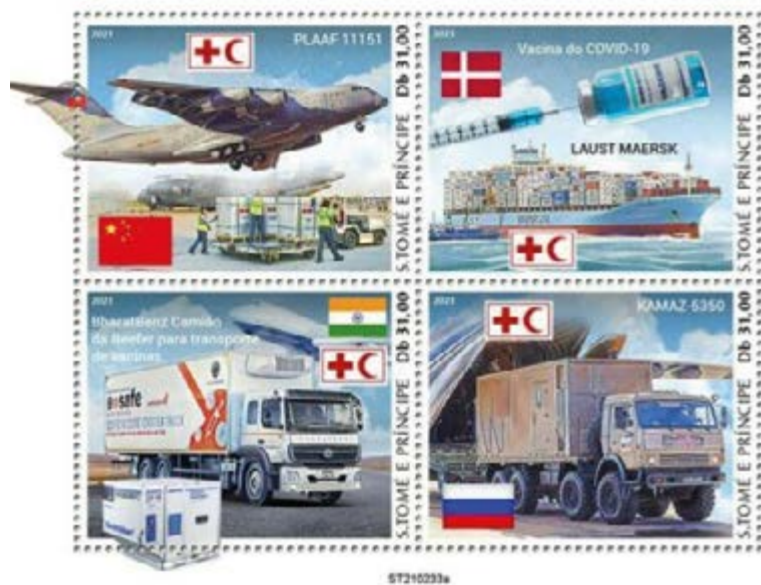
Transporte da vacina do COVID-19

Proprio per questo, il Piano strategico nazionale 2021-2030 per lo sviluppo della Mobilità aerea avanzata dell'Enac individua nel trasporto di materiale biomedicale una delle principali applicazioni sulle quali puntare. In Italia, Enac ha finora autorizzato solo alcune sperimentazioni che hanno simulato il trasporto con droni di materiale sanitario biologico, in operazioni con volo a vista (Visual Line of Sight - VLOS) e con volo oltre la linea di vista (Beyond Visual of Sight - BVLOS). Le richieste comunque non mancano.