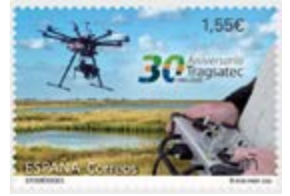
Nel francobollo spagnolo del 2020, l'utilizzo dei droni, da parte dell'azienda Tragsatec, è rappresentato da un ottocottero