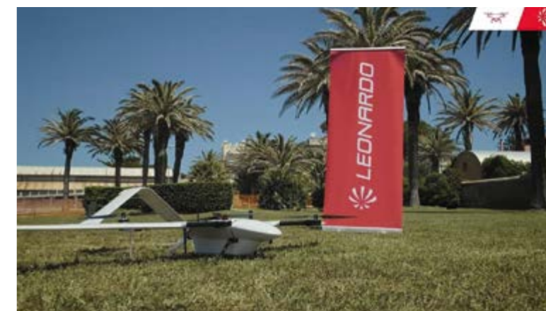
L'ultima evoluzione del drone di Leonardo

Nel maggio 2021 Leonardo, replicando le precedenti collaborazioni, ha proseguito con una seconda fase di sperimentazioni, sempre in ambito biomedico. In questo caso, a differenza della fase precedente, la sperimentazione ha visto l'impiego di un drone elettrico dotato di una nuova tecnologia più evoluta, con una modalità di controllo automatico oltre il campo visivo dell'operatore e con una rotta più lunga e lontana dalla costa.